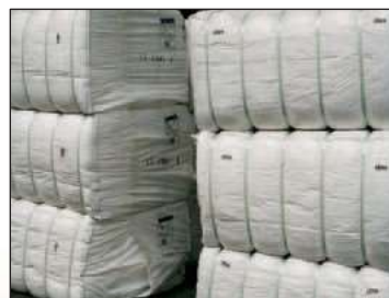
Bala kemičnih vlaken